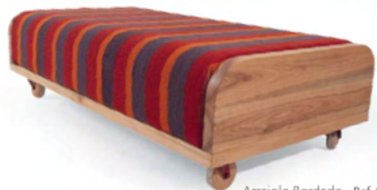
Arraiolo Bordado Ref. 830

A inusitada aplicação do bordado arraiolo feito à mão no revestimento da banqueta de madeira de eucalipto. O estofamento também pode ser em lona ecossustentável fabricada com fios de algodão e PET reciclado.